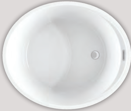
BEONE 4639 (AUTOPORTANT)